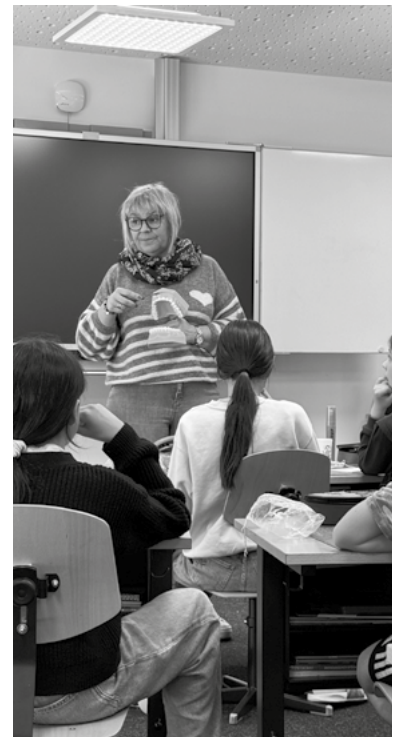
Prophylaxie dentaire dans une classe de 8H

Les réflexions et les projets pour améliorer le dépistage des élèves dans les écoles se poursuivent. Un Kit transportable, utilisable par les dentistes dans les écoles a été testé.