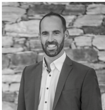
Fabrice Fournier, Président de l'Assemblée