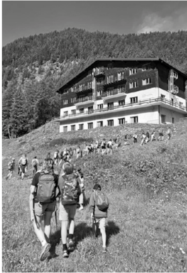
Camp SN et SHS à Grimontz

Les animateurs SN et SHS du Cycle 2 ont conçu un camp nature clé en main d'une semaine, qui a été expérimenté par le centre scolaire de Veysonnaz. Cette expérience s'est révélée concluante et son intégration dans le cursus scolaire apparaît pertinente.