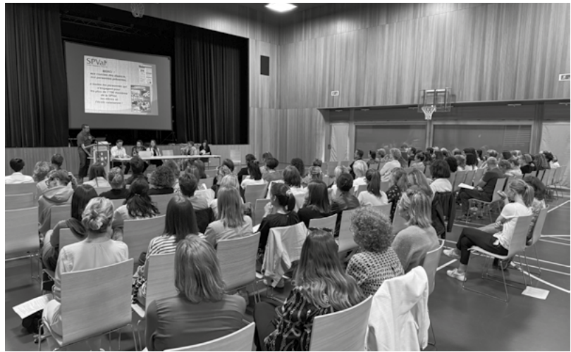
Assemblée Générale du district de Sierre à Chermignon

Le Comité de district soutiendra toute initiative innovante permettant d'améliorer le vivre-ensemble dans les classes.