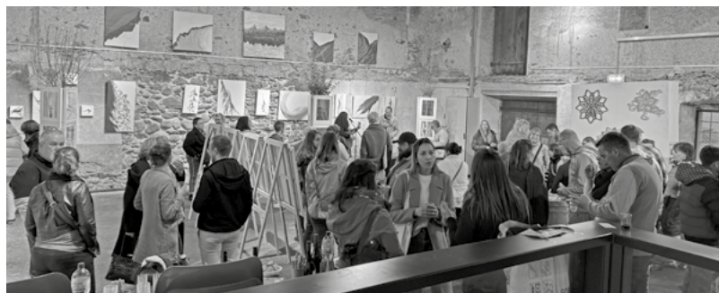
Vernissage de l'exposition des enseignants artistes à Martigny