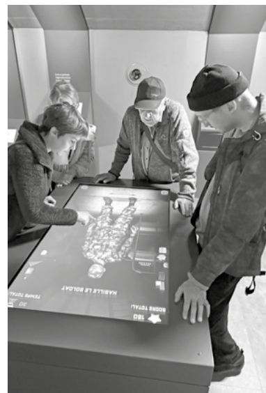
Défi interactif, équiper un soldat le plus vite possible

La visite de l'imprimerie du Nouvelliste, prévue le 25 septembre, a finalement été annulée faute de participants.