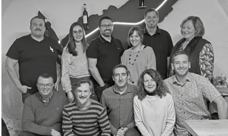
Comité Cantonal de la SPVal

Pour une bonne gestion et une mise à jour des données internes, les différents changements doivent impérativement être annoncés à la SPVal en plus des démarches auprès de la direction.