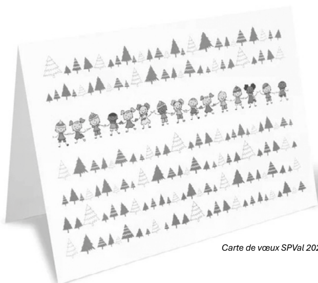
Carte de vœux SPVal 2025

"La SPVal, c'est TOI, c'est MOI, c'est NOUS!"