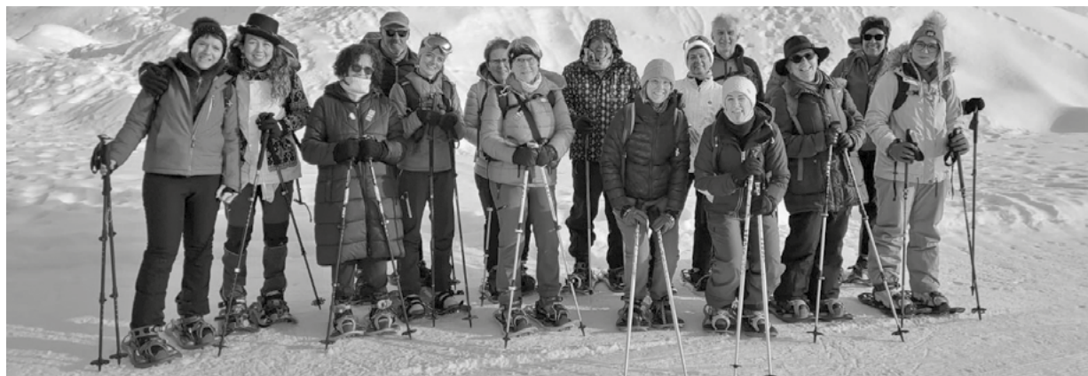
Sortie en raquettes à Wiler