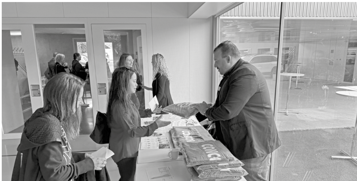
Distribution des linges CONCORDIA aux délégués