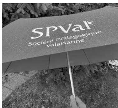
Protégés dans tous les cas !

Les personnes de contact de chaque centre scolaire constituent des relais supplémentaires dans les écoles et les salles des maîtres. Pour les remercier de leur travail, un parapluie SPVal a été transmis afin de les protéger des intempéries lors des surveillances des récréations.