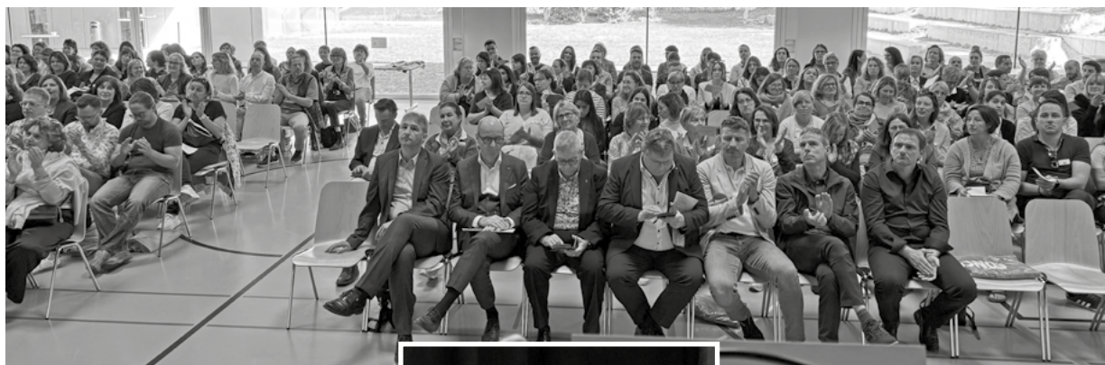
Assemblée des délégués à Aproz.

En tant que président du jour, je remercie chaleureusement toutes les personnes qui ont contribué au bon déroulement de cette assemblée.